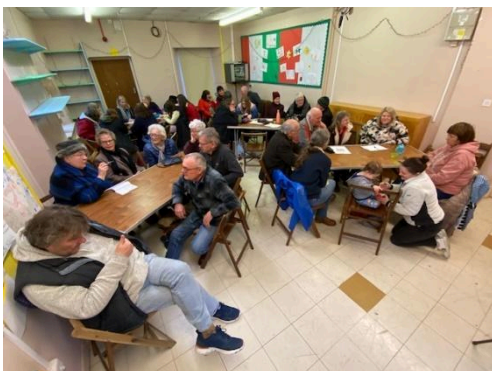
Sesiwn Crafu Pen yn ystod Ffair Sant Silin yn gynharach eleni a esgorodd ar lond fflip-siart o syniadau cyfoethog